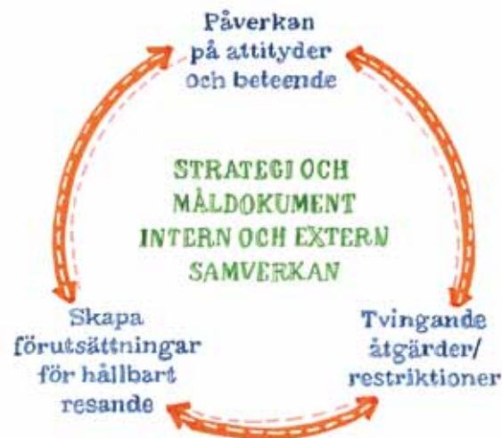
Figur 2: Planer och verksamhet för "hållbart resande" måste samordnas med övrig kommunal verksamhet, och utformas så att den tydligt bidrar till kommunens övergripande utvecklingsmål (figuren visar ett exempel på samordning).