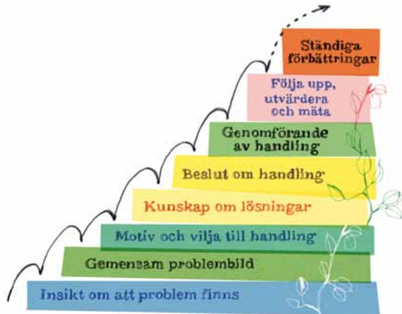
Figur 4: Steg i en så kallad utvecklingstrappa som på ett förenklat sätt beskriver en verksamhets eller organisations stegvisa utveckling.

tera i en integrering i den ordinarie verksamheten kan jämföras med att utvecklingen följer en trappas olika steg (se illustration ovan).